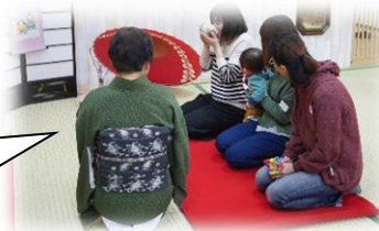
3/9 ママサロン ひな祭りの様子。お抹茶を 点てて楽しみました♪