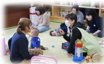
2/23 ママサロン もぐもぐ相談の様子

ママサロンは毎回、 軽食バイキング&おやつ& お茶の提供があります。 マイカップをご持参ください。