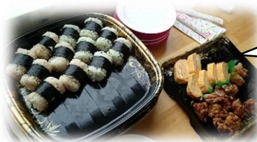
リラックスサロンの様子。軽食バイキング♡♡